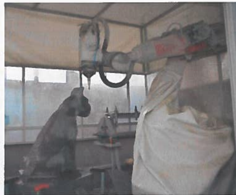
Figure 1 Un savoir-faire unique ! Les métiers de la pierre témoignent d'un savoir-faire français reconnu partout dans le monde, qui n'est pas sans intégrer les nouvelles technologies.