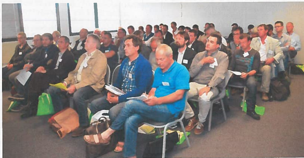
Figure 3 Les professionnels rhônalpins étaient nombreux au rendez-vous de l'assemblée constitutive du 26 mai

Contact : SNROC, UNICEM Rhône-Alpes, Maison de la Pierre au Ciment (Montalieu) Mail : rhonealpespierres@gmail.com